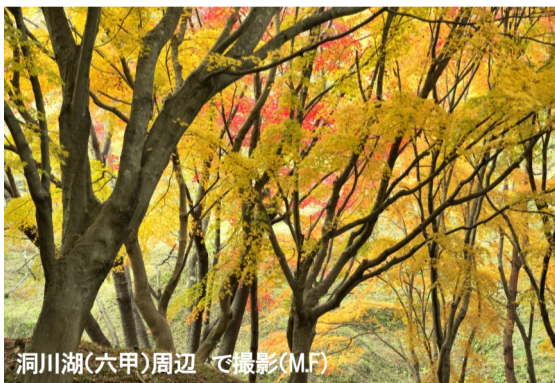
洞川湖(六甲)周辺で撮影(MF)